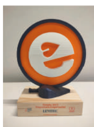
Premio Trayectoria Empresarial Clúster Energía Aragón 2023