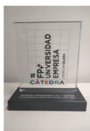
Premio a la Labor Docente y Desarrollo de Talento Fundación San Valero 2023