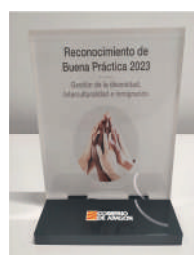
Premio a la Buena Práctica Laboral y de Empresa Gobierno de Aragón 2023